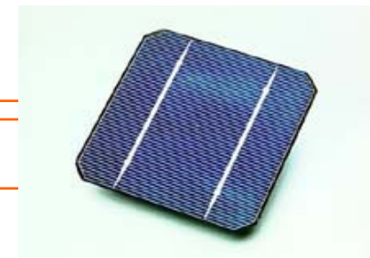
Vente de panneaux photovoltaïques en Suisse